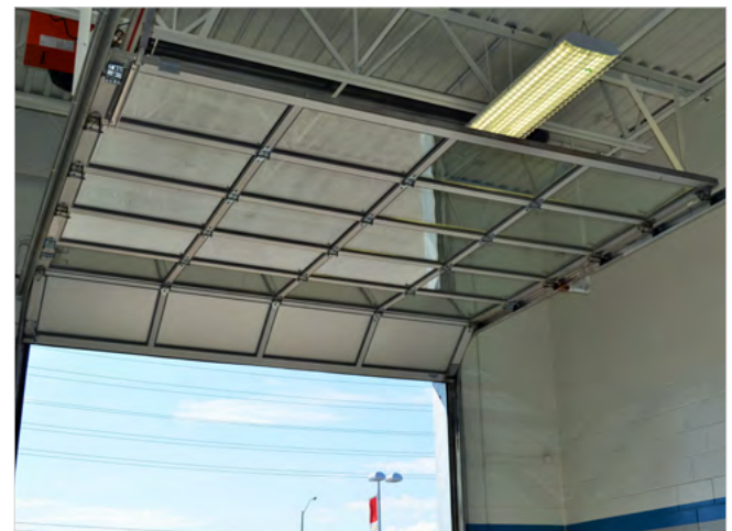
ALLIAGE D'ALUMINIUM 6063-T6 FINI ANODISÉ TRANSPARENT STANDARD